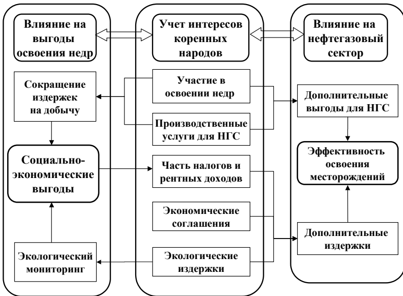
Рис. 4. Потенциальные выгоды и издержки основных участников процессов недропользования: учет интересов коренных народов

Для оценки потенциальных выгод (для коренных народов, государства и недропользователей) от реализации нефтегазовых проектов на территориях традиционного природопользования была разработана методика, основу которой составляет схема расчета денежных потоков, генерируемых при осуществлении нефтяного проекта. Общая структура схемы расчетов по оценке социально-экономических выгод реализации нефтяного проекта с акцентом на учет интересов коренных народов представлена на рис. 4.