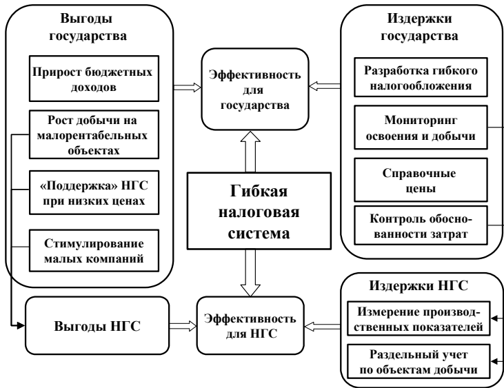
Рис. 3. Выгоды и издержки применения гибких подходов к налогообложению добычи нефтегазовых ресурсов

В современных условиях в России начался переход к гибкой системе налогообложения в нефтедобыче по производственному принципу (с учетом выработанности запасов, местоположения участков недр). Реализация гибких подходов необходима и в газовой промышленности. При построении системы дифференцированного налогообложения в газодобыче следует учитывать, прежде всего, различия в глубине скважин (залегания продуктивных пластов).