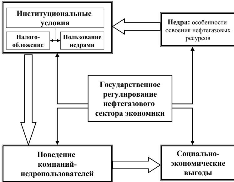
Рис. 1. Общая структура подхода к исследованию институциональных условий в нефтегазовом секторе

Проблемы формирования адекватных институциональных условий в недропользовании необходимо рассматривать с точки зрения создания предпосылок для повышения социально-экономических выгод освоения недр для общества. Предлагаемый и реализуемый подход к исследованию проблем недропользования (на примере НГС) включает следующие блоки: недр (особенности и динамика освоения нефтегазовых месторождений и провинций) – институциональные условия – поведение недропользователей – социально-экономические выгоды освоения недр (рис. 1).