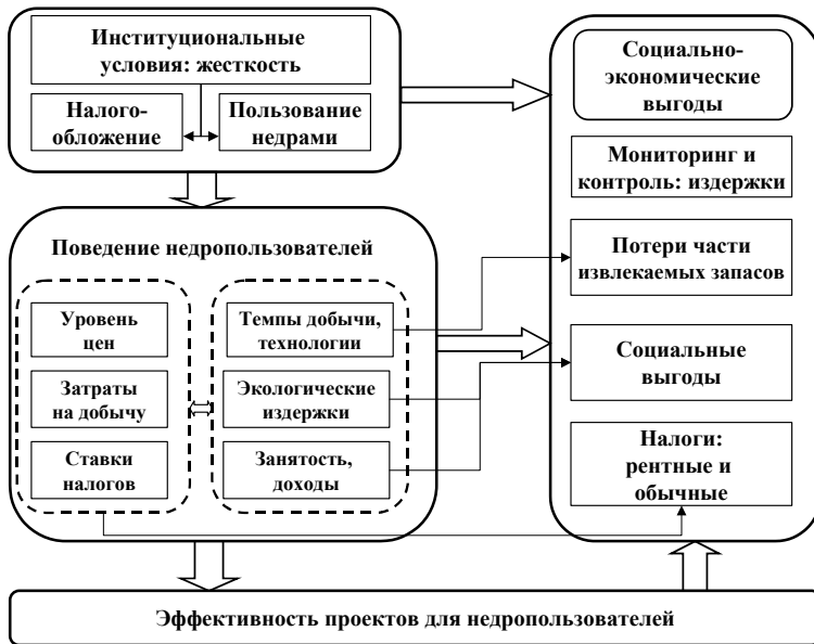
Рис. 5. Общая структура методического подхода к анализу институциональных условий в недропользовании

туциональных условий, является уровень социально-экономических выгод освоения недр. Предполагается, что разработка месторождений осуществляется только в том случае, если прогнозируемая эффективность (внутренняя норма рентабельности) реализации проектов с позиций недропользователей превышает минимальный требуемый уровень (рис. 5).