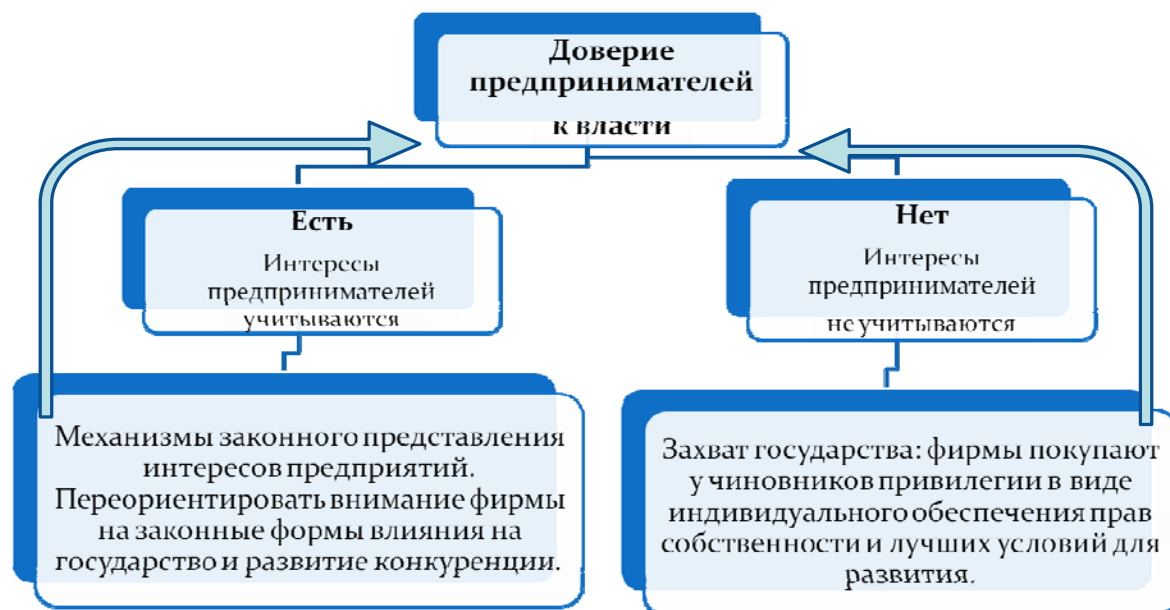
рис.2. Механизм институциональной комплементарности

Отсутствие доверия предпринимателей к системе власти связано с возникающими в связи с этим дополнительными издержками и ухудшает условия функционирования малого бизнеса. Приводится методика определения степени доверия предпринимателей к власти, разработанная на основе методики Всемирного Банка 14 , результаты апробации этой методики на анкетном опросе предпринимателей сибирских регионов, входящих в “Межрегиональную ассоциацию Сибирское соглашение”.